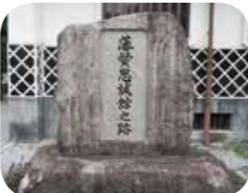
藩校「思誠館」跡地の碑