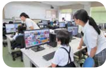
パソコンを教わる3年生