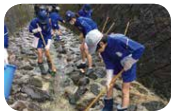
風木谷の石畳を掃除する6年生

思誠小学校では6年生が卒業奉仕活動として、校舎横にある「風木谷」の石畳と体育館横にある「鳳凰門」の清掃を地区の民生委員の皆さんと一緒にしています。鳳凰門は大変古い門で、卒業式当日だけ大きく門が開かれ、卒業式を終えた6年生が保護者と一緒に門をくぐって学び舎を築立っていく古くからの伝統があります。