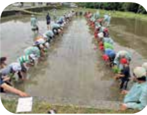
生物生産科の生徒と一緒に田植えをする5年生

思誠小学校では、隣接する新見高校北校地との交流を長年行っています。交流は新見高校北校地の前身である新見北高校の頃から始まり、約20年間続いています。北校地とはグラウンドを共有しており、小学校と高等学校との連携協力を進めています。今年度も、2年生はさつまいも作り、3年生はパソコンを活用したカレンダーや年賀状の作成、5年生は米づくりのための田植えや稲刈り、ライ