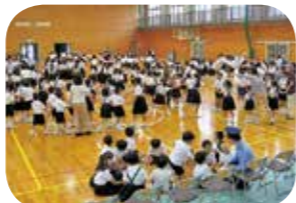
「思誠っ子集会」ゲームの様子

思誠小学校では、毎年6月に「思誠っ子集会」を行っています。この会では、子どもたちの毎日の登下校を見守ってもらっている「思誠小防犯パトロール隊」の皆さんへ感謝の気持ちを表しています。6年生が企画をして、お礼のプレゼントを贈ったり、一緒にゲームをしたりしています。普段は、なかなかお礼が言えないのですが、この日は交流を通して感謝の心が伝わる集会となりました。