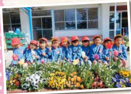
高梁市立高梁幼稚園