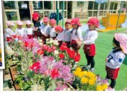
倉敷市立呉妹幼稚園