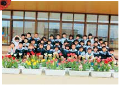
津山市立つやま東幼稚園