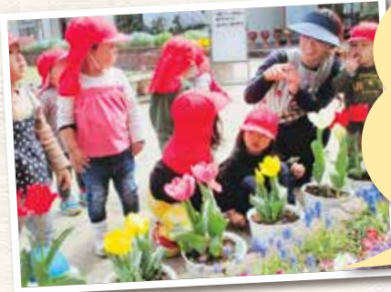
玉野市立玉原認定こども園

うっすらと色づいた小さな芽を見つけたときには、大喜びで先生やお母さんに報告しました。きれいに咲き揃ったチューリップを「さいたさいた赤白黄色」と、先生と一緒に口ずさみながら嬉しそうに見ています。