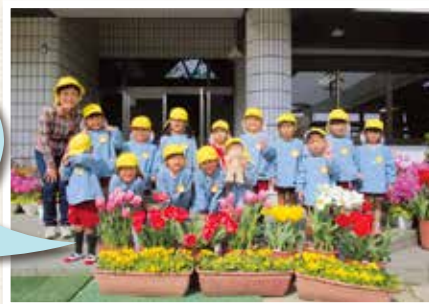
岡山市立鯉山幼稚園

球根を初めて手にした子どもたちは「わぁ、玉ねぎみたい」と不思議そうに見ていました。また、「ふわふわのお布団をかけようね」と、そっと土をかぶせ優しく扱う姿も見られました。