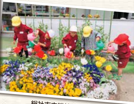
総社市立総社北幼稚園