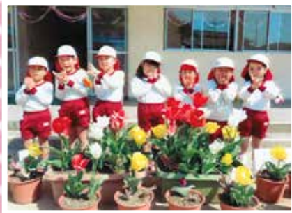
倉敷市立赤崎幼稚園