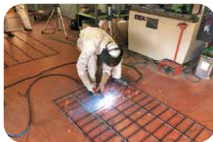
地域の害獣捕獲のための檻の制作

本校は少子高齢化がすすむ備前市唯一の県立高校として、地元産業の担い手を育成する機関として期待されています。「総合的な探究の時間」を「びぜんみらい学(地域学)」と位置づけ、備前市および備前市教育委員会、備前商工会議所、備前観光協会などと連携・協働した学習活動に取り組んでいます。このプロジェクトはこれまで積極的に取り組んできた社会貢献活動や授業等における地域との連携を一体的にとらえ、生徒達の主体的に学ぶ態度や課題発見・解決能力の育成と、本校が備前市の活性化に寄与することを目的としたものです。