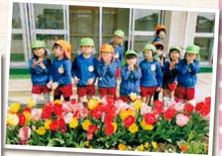
岡山市立芳泉幼稚園