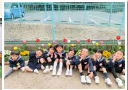
瀬戸内市立今城幼稚園