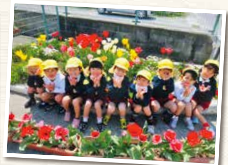
岡山市立浮田幼稚園