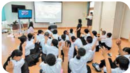
オーストラリアの中学校との遠隔授業

「教育のまち」を掲げる和気町では、英語に特化した無料の公営塾や外国人講師から個別指導が受けられる無料オンライン英会話講座を設けたり、英語検定取得を推奨したりするなど、特に英語教育に力を入れています。本校も平成28年度から英語特区の指定を受け、「オーラル・コミュニケーション」の授業を新設するなど、授業時数を増やし4技能をバランスよく身に付ける英語教育に取り組んでいます。こうした校内外での教育活動を通して、日常英会話によるコミュニケーションが取れる人材や、実践的な国際感覚を持った人材の育成を目指しています。