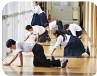
清掃（床も心も日本一）

これは、平成18年度生徒総会で決議された「和気中日本一のための3か条」です。「先輩たちの熱い思いを忘れない。」を合言葉に、生活の指針として受け継がれてきています。学校生活アンケートでは、ほとんどの生徒が、「3か条を意識して頑張っている。」と回答しており、あいさつ、掃除、歌声が和気中学校の生徒にとって誇りとなっています。今では、地域の方々にも認識され、生徒の生き生きとした校内外での活動は、地域の誇りにもなっています。