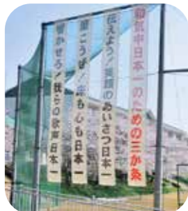
和気中日本一のための3か条