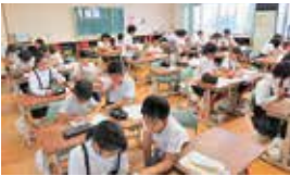
異学年朝学習の様子

毎週木曜日の朝学習では、6年生と4年生、5年生と3年生がペアで「異学年朝学習」を行っています。算数の問題を中心に、5・6年生が事前にペアとなる下学年の児童の問題を解き、その教え方を考えておきます。当日はペアの児童の様子を見ながら、アドバイスをしたり丸付けをしたりします。下学年の児童は、分からない箇所を丁寧に教えてもらうことで基礎学力の向上を目指し、上学年の児童は、既習事項の復習と説明する力をつけることを目指しています。児童同士の関わり合いは、意欲的な取り組みにつながっています。