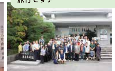
一日研修旅行(足立美術館)

交流会では、総会同様、記念公演や懇親会を企画・実施しています♪ 一日研修旅行は、「宿泊を伴う旅行が難しい」というお声から企画した日帰りバス旅行です♪