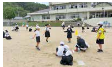
なわとび検定の様子

体育の授業だけでなく月曜日の昼休みに「大野っ子タイム」を設定し、月に1回、全校で「なわとび検定」を行っています。縦割り班で取り組み、結果を個人カードに記入していくことで、児童は意欲的に取り組むことができます。