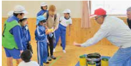
三世代交流会 ゲームを楽しむ様子