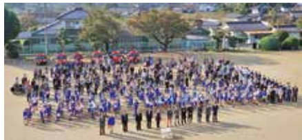
三世代交流会 30回記念集合写真

「大野鍋」は地域の栄養委員さんと愛育委員さん達が、地域の方や児童が作った野菜や餅米を使い、約500食を前日から仕込んで用意してくださっています。地域の力が集結した交流会を、来年度は開催できることをみんなで願っています。