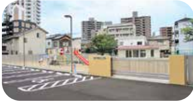
第2園庭・保護者用駐車場

岡山市鹿田認定こども園は、岡山市立鹿田幼稚園と岡山市鹿田保育園が統合し、令和2年4月から幼保連携型認定こども園として開園しました。幼稚園跡地に建てられた園舎は3階建てで、現在0歳児クラスから5歳児クラスまで計14クラスがあり、276名(令和3年7月1日現在)の子どもたちが在籍しています。徒歩1分程度の所にある保育園跡地は、令和3年7月より第2園庭・保護者用駐車場として使用しています。