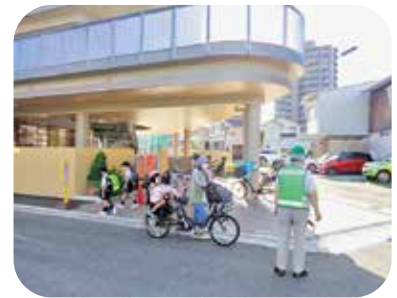
登園を見守ってくださる地域の方

交流は難しい状況ですが、登園の見守りや週1度の挨拶運動などで地域の方に支えられています。