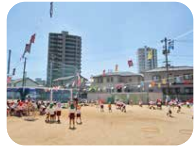
手作りこいのぼりと一緒に!

本園では、特に「体をしっかりと動かして遊ぶ」ということを大切にしています。乳幼児期に全身を使って遊ぶ経験は、心身の発達に欠かすことができません。園庭、保育室、廊下、遊戯室などに、子どもたちが「楽しそう」「やってみたい」と思えるような環境を、各学年・クラスが工夫し準備しています。友達と一緒に何度も繰り返しかかわり、伸び伸びと遊ぶ中で、心も体もしなやかな子どもを育てていきたいと思っています。