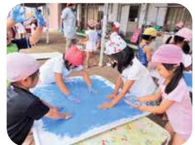
こども園にはわくわくがいっぱい

本園では、職員同士のコミュニケーションを特に大切にしています。挨拶や感謝の言葉掛けはもちろん、子どもの姿の共通理解や環境についての情報交換など、保育の合間の少しの時間を見付けて積極的に行っています。職員同士が笑顔で話していると、その笑顔は子どもにも広がります。子どもの笑顔をいっぱいにするには、まずは職員が笑顔でいることが大切だと思っています。子どもも職員もにこにこ笑顔の鹿田認定こども園です。