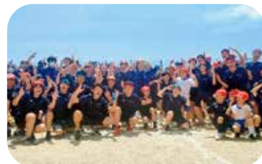
山南スポーツフェスティバル

学園では、これらのタイムマシン活動を行う中で、子どもたちが自分を高め、未来を切り開くことができるよう成長できる学校を目指しています。