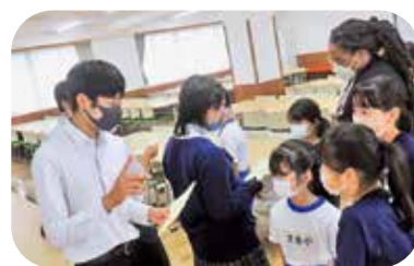
9年生と4年生が英語で交流