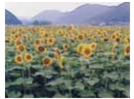
日帰り旅行 ～佐用町のひまわり畑～

（年に1・2回）、卒業生（中学校）が誘ってくれるランチ（年に3回程度）ぐらいです。これらは、私が前進するためのパワーアップに大切な時間で、母のためにも続けていきたいと思っています。さらに挑戦したいことは、日帰り旅行を発展させて、泊を伴う国内旅行の実施です。かつて、仕事で行った場所をゆっくりと回って