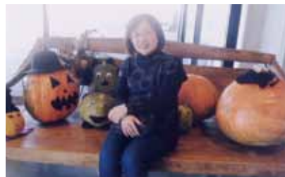
卒業生とのランチ

（年に1・2回）、卒業生（中学校）が誘ってくれるランチ（年に3回程度）ぐらいです。これらは、私が前進するためのパワーアップに大切な時間で、母のためにも続けていきたいと思っています。さらに挑戦したいことは、日帰り旅行を発展させて、泊を伴う国内旅行の実施です。かつて、仕事で行った場所をゆっくりと回って