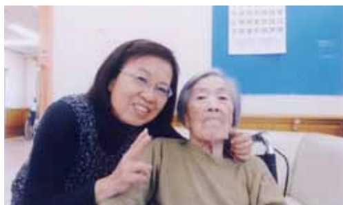
Before & After

想像しただけで笑みがこぼれてきます。この夢を実現させるためには、間違いなく、母の後を追っている私の心身の健康・元気がなければ難しいことです。これからも、身体を壊さない程度の運動を継続して、健康な生活を母と二人で送りたいと思っています。さあ、寒さに怯むことなく、「ウォーキングに、行ってきます!!!」