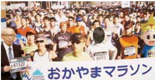
2017.11.11 第3回おかやまマラソン前日 ナンバーカード引き換えるもコンディション不良で出走棄権

現役時代は、ランニングにハマってしまい、フルマラソンだけでも、北海道（札幌）、東京、京都、大阪、神戸など全国の大規模な大会への参加の機会を得ることができました。そして何よりも有り難かったことは、ランニングを通して仕事関係を超えて人間関係が大きく広がったことでした。ランニングブームと言われて久しいですが、ブームとなった要因の一つにこのことがあるのではないかと思います。