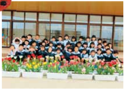
津山市立つやま東幼稚園