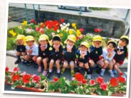
岡山市立浮田幼稚園