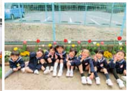
瀬戸内市立今城幼稚園