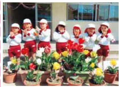
倉敷市立赤崎幼稚園