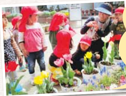
玉野市立玉原認定こども園

うっすらと色づいた小さな芽を見つけたときには、大喜びで先生やお母さんに報告しました。きれいに咲き揃ったチューリップを「さいたさいた赤白黄色」と、先生と一緒に口ずさみながら嬉しそうに見ています。