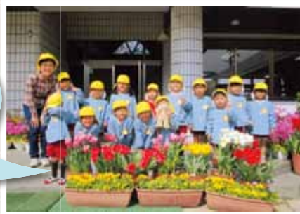
岡山市立鯉山幼稚園

球根を初めて手にした子どもたちは「わあ、玉ねぎみたい」と不思議そうに見ていました。また、「ふわふわのお布団をかけようね」と、そっと土をかぶせ優しく扱う姿も見られました。