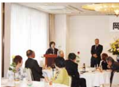
参加者の方から会場（笠岡グランドホテル）にあるミュージアムをご紹介いただく場面もありました。