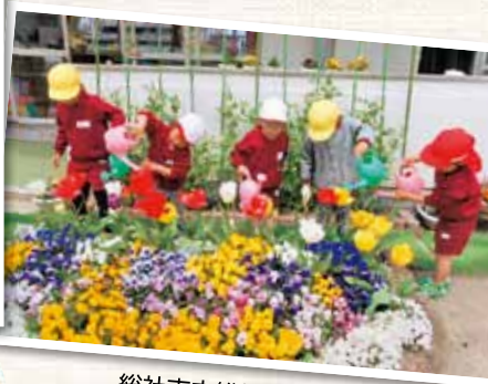
総社市立総社北幼稚園