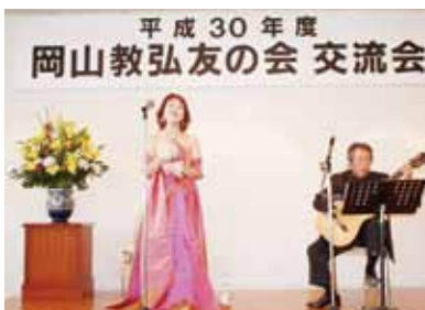
クラシックギター＆ソプラノの美しい演奏