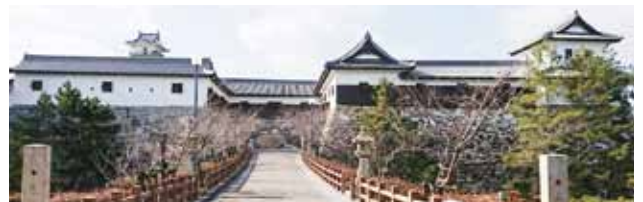
2020.1.21 予想外に感銘を受けた今治城 天守は史実に基づかないが、築城の名手藤堂高虎による見事な縄張りは近世城郭の完成形？

以前、趣味の目標としていた「フルマラソン100回完走」は難しくなりましたので、新たな達成可能な目標として「城郭100城探訪」を掲げてみようかと考えていましたが、これまたコロナ禍により頓挫。探訪再開できる日まで、当面は座学にて城郭研究します。