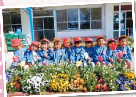
高梁市立高梁幼稚園