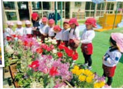
倉敷市立呉妹幼稚園