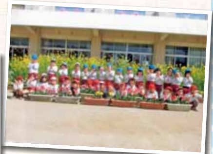
倉敷市立玉島幼稚園