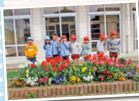
総社市立久代幼稚園

昨年11月上旬に年中組が、「どんな色が咲くんかなあ」と期待をもちながら、一人1球ずつ植えました。毎日当番がやる気をもって水やりや草ぬきをし、世話する様子が見られました。「チューリップの芽が出ると!」「なんか大きくなってない?」と生長に驚いたり、じっと見つめたりする姿があり、花が咲いた時には、みんなで大喜びしました。