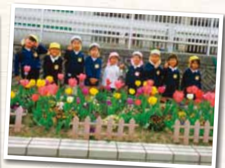
岡山市立桃丘幼稚園