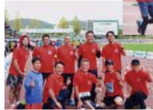
メンバーで記念写真