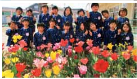
瀬戸内市立行幸幼稚園