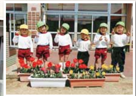
備前市立東鶴山認定こども園