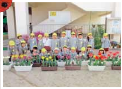
岡山市旭竜認定こども園