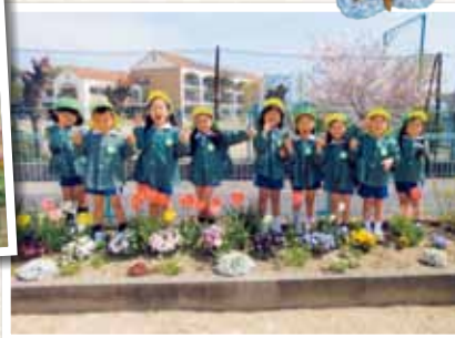
瀬戸内市立牛窓東幼稚園