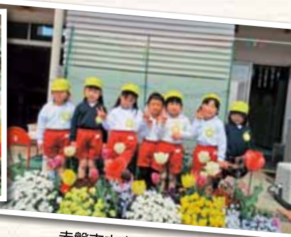
赤磐市立山陽北幼稚園