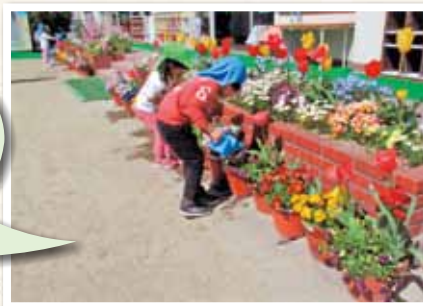
玉野市立八浜認定こども園

昨年11月に年中児30名が、一人一人植木鉢にパンジーの苗との寄せ植えをし、花が咲くことを楽しみに、水やりや観察を行いました。そして、年長児の卒園式には、花道を作ってお兄さんお姉さんをお祝いすることができました。