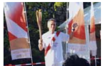
東京オリンピックに聖火ランナーとして参加

走ることの素晴らしさを再認識、今後もジョギングを続けて、いつかはフルマラソンに挑戦したいです。