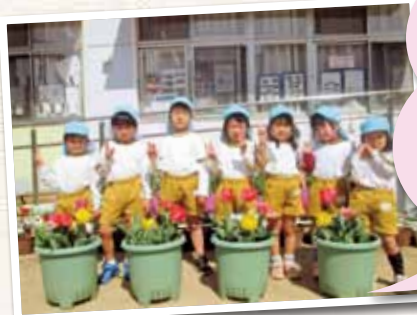
倉敷市立船穂幼稚園

昨年11月上旬に年中組が、「どんな色が咲くんかなあ」と期待をもちながら、一人1球ずつ植えました。毎日当番がやる気をもって水やりや草ぬきをし、世話する様子が見られました。「チューリップの芽が出ると!」「なんか大きくなってない?」と生長に驚いたり、じっと見つめたりする姿があり、花が咲いた時には、みんなで大喜びしました。