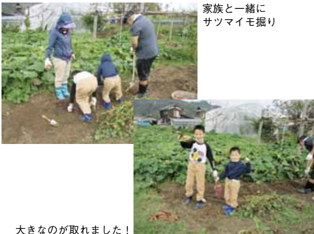
家族と一緒に サツマイモ掘り

初めてなので、近所の方のされていることを見よう見まねでしています。不思議なもので、今まで気にならなかった畑の様子が目に入るようになり、玉ねぎはあの間隔で植えたらいいのかとか、なすの葉は大きく広がるように誘引してやればいいのかとか、この畑は草が一本もない、うちも早く草抜きをしないとなど、大いに参考にしています。